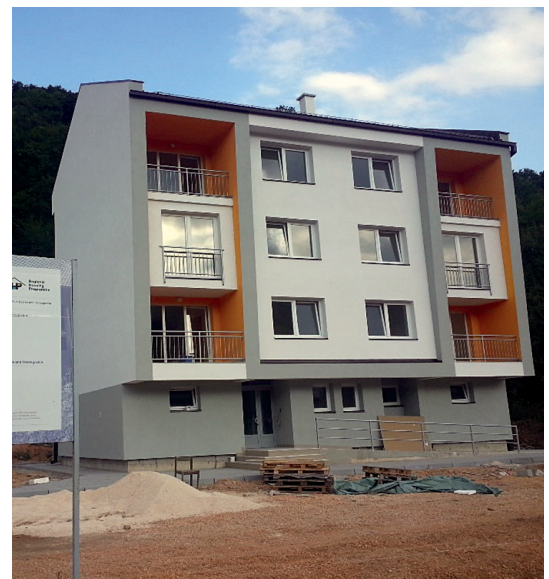
Završena zgrada, Pale-Prača, septembar 2017.